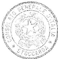
Massimo Darchini Consule Generale